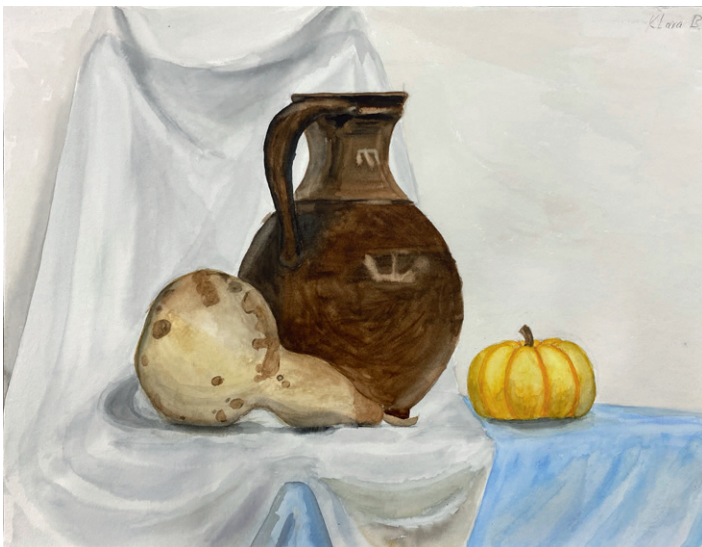
Klara Bratek, Stillleben, 50 x 42 cm, Aquarell auf Papier