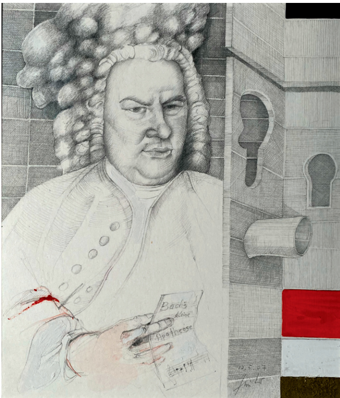
Bachs Apotheose, 245 x 220 mm, Bleistiftzeichnung mit etwas Buntstift