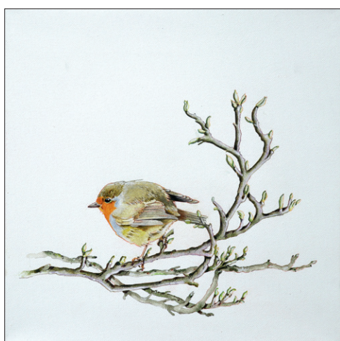
Klaus Menzel, Rotkehlchen 30 x 30 cm, Aquarell, Acryl auf Leinwand

Rolf Geissler (siehe Artikel über den Künstler in dieser Ausgabe) sagt, die Grafiken (Kunst) muss man sehen, riechen und schmecken. Bis dahin besuchen Sie die virtuelle Kunstgalerie-Neuss.de und vielleicht entdecken Sie für sich den einen oder anderen Künstler, den Sie später (nach Corona) auch gerne persönlich kennenlernen möchten.