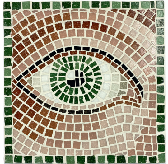
Klara Bratek, Glasmosaik, 20 x 20 cm