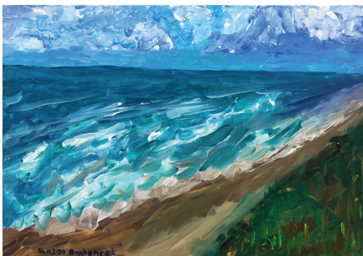
Brakensiek Ben, 10 J., 2020, 60 x 40 cm, A/LW