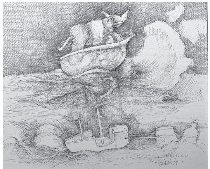
Navigare necesse est Nr 26., 193 x 235 mm, Federzeichnung Es gibt gewichtige Gründe von Bord zu gehen.