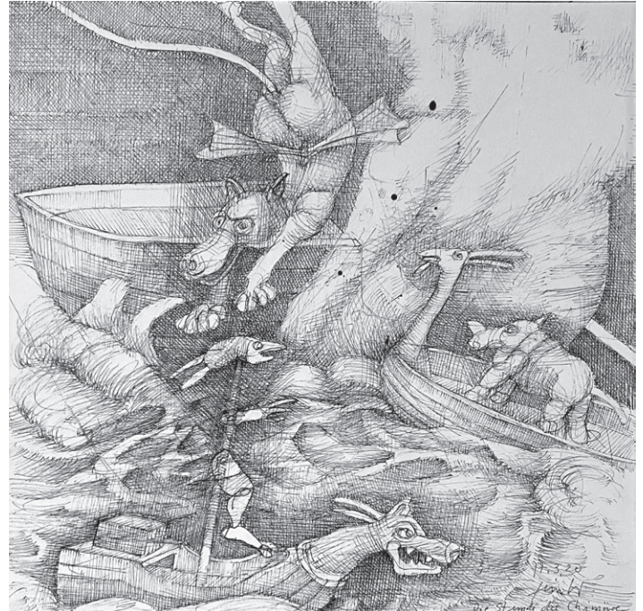
Navigare necesse est Nr 43., 240 x 250 mm, Federzeichnung Die Stunde der Chimäre