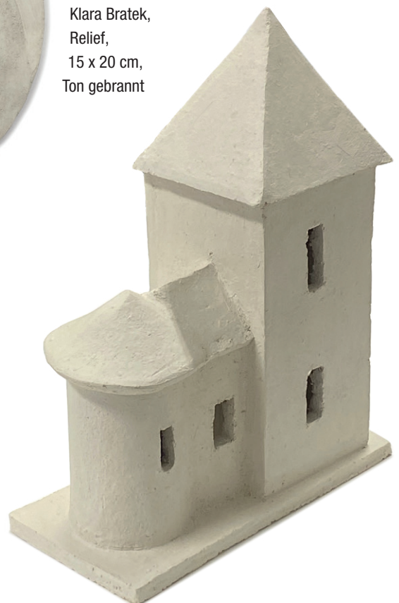
Klara Bratek, Hausmodell, 8 x 16 x 20 cm, Ton gebrannt