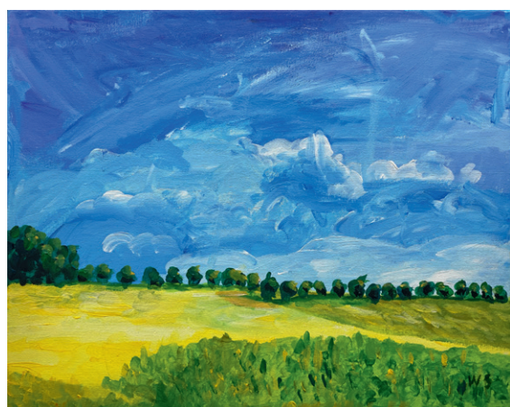
Shanning Wang, 7 J., 2020, 50 x 40 cm, A/LW