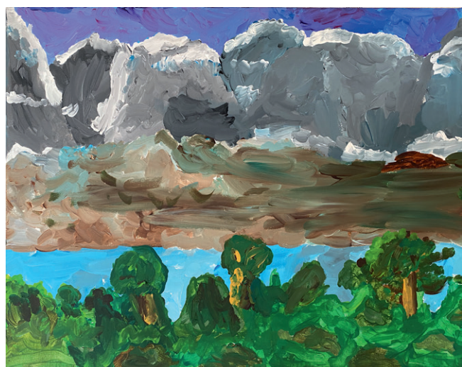
Mark Link, 8 J., 2020, 60 x 50 cm, A/LW