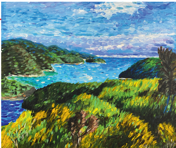
Leona Grips, 16 J., 2020, 60 x 50 cm, Acryl auf Leinwand (A/LW)

Auch wenn sich Corona uns in den Weg gestellt hat, haben einige Schüler der Kunstschule Neuss ihre Abschlussarbeiten 2020 doch noch fertig gemalt. Das Thema diesmal war Claude Monet. Und wenn man sich die Arbeiten anschaut – der Meister hätte sich über „seine“ Schüler bestimmt sehr gefreut. Im Fokus der Aufgabe stand die für Monet spezifische freie Pinselführung mit langen und kurzen Pinselfrichen und einem satten Farbauftrag. Auch seine breite Farbenpalette durfte in den Arbeiten der Schüler nicht fehlen. Ende Juni wird die Kunstschule Neuss in ihrer Jahresausstellung alle Abschlussarbeiten zeigen. Auch im Bereich der Architektur, Tonmodellierung, Aquarellmalerei und Zeichnen wird das hohe Niveau der Schüler der Kunstschule Neuss gezeigt.