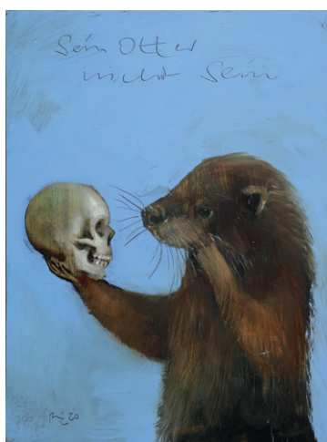
Christoph Rehlinghaus, Sein Otter nicht sein 30 x 40 cm, Öl auf MDF