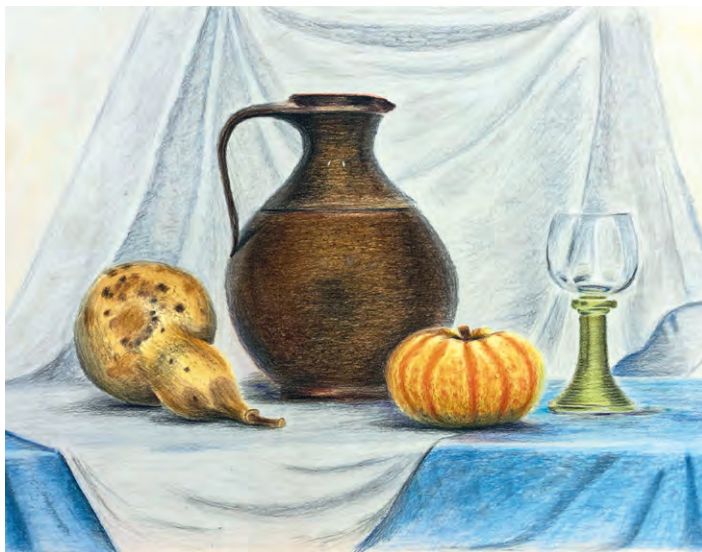
Annette Schwerdtner, Stillleben, Pastell auf Papier, 56 x 42 cm