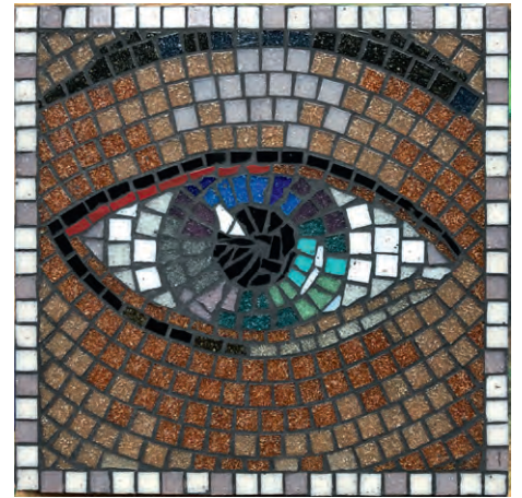
Clara Schulze, Glasmosaik, 20 x 20 cm