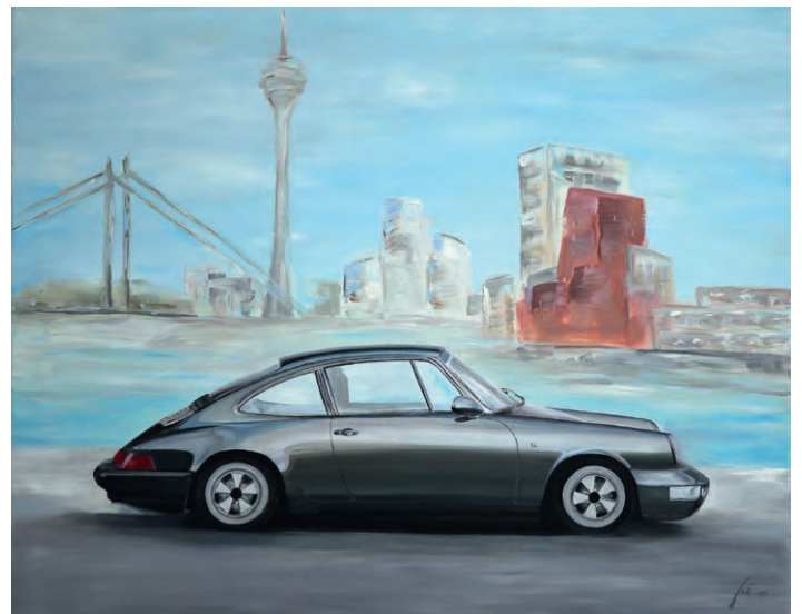
Angelika Gummersbach, Porsche, Öl auf Leinwand, 100 x 80 cm