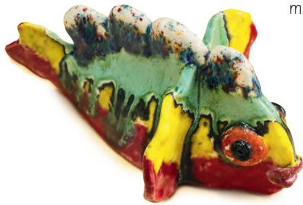
Stella Lichtenwald, Keramik, ca. 20 x 15 x 12 cm

Darunter die Architekturmodelle (siehe auch die Titelstory) zum Thema „Naturschonendes Bauen & Wohnen“, Abschlussbilder zum Thema „Kubismus“ oder Tonreliefs von „Nofretete“, konstruktive Zeichnungen oder Stillleben mit Aquarellfarben oder Pastellkreide. In der Ausstellung wurde wieder eine breite Palette von Angeboten der Kunstschule Neuss deutlich sichtbar. Einige Exponate sind in der Dauerausstellung der Kunstschule Neuss noch bis zum Jahresende zu sehen.