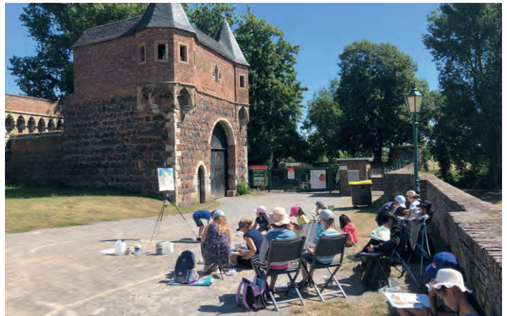
Feste Zons, Dormagen