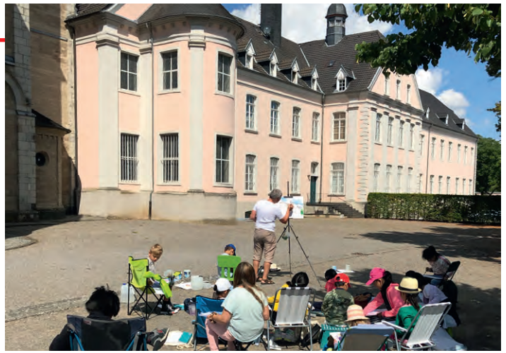
Kloster Knechtsteden, Dormagen

Auch in diesem Sommer erkundeten die Schüler der Kunstschule Neuss die umliegenden Sehenswürdigkeiten des Rhein-Kreises Neuss. Und jedes Mal, auch wenn sie die Orte schon ein paar Mal gezeichnet haben, entdecken sie neue Ansichten und viele interessante Details. Einen herzlichen Dank möchten wir hier den Besitzern des Schloßes Hülchrath und der Müggeburg aussprechen dafür, dass sie die Anlagen in „Anspruch“ nehmen durften. Die entstandenen Zeichnungen und Aquarelle werden wir ab Mitte September in der NeusserReha in Rosellerheide und auf der Jahresausstellung der Kunstschule Neuss Ende Juni 2021 den Besuchern präsentieren.