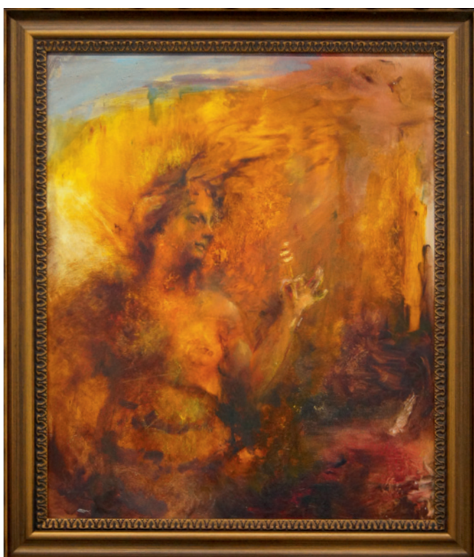
Die Bienenkönigin, Öl auf Leinwand