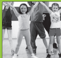
Kindertanzen (3-7 Jahre)

„ Alle Generationen tanzen in der Tanzfabrik. “