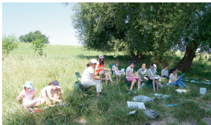
Natürlich darf der Rhein nicht fehlen.