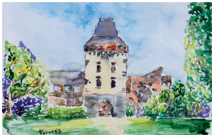
Tosheva Farangis, Feste Zons, Burg Friedestrom, Aquarell auf Papier.