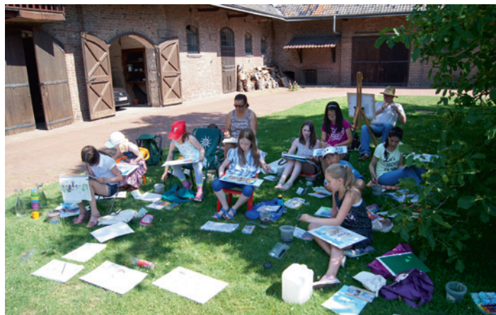
... und auch in der Müggenburg, Neuss-Norf.