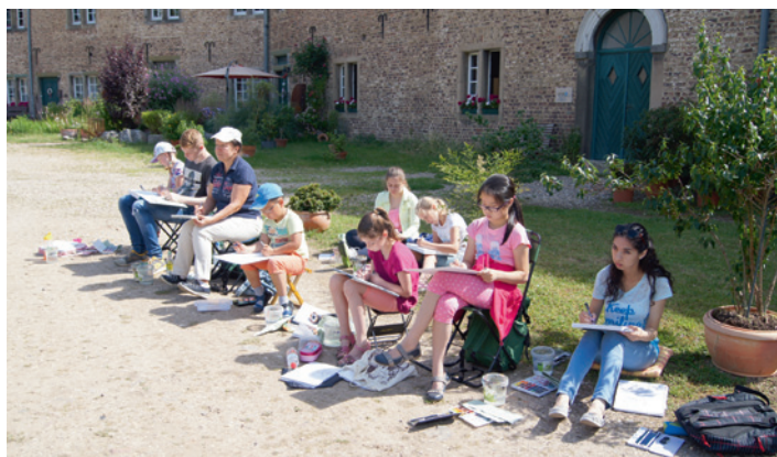
Der Klassiker – Schloß Hülchrath.

Auch in diesem Jahr hat die Kunstschule Neuss in ihrem Programm den Unterricht im Freien. Wie auch in den vergangenen Jahren wurde der „erweiterte Unterricht“ von den Schülern und Eltern mit Begeisterung empfunden. Egal ob „Große“ oder „Kleine“ – es wurde 2 Stunden durchgehend „hart“ gearbeitet. Das Resultat kann sich sehen lassen. Diesmal wurden auch neue Orte erkundet wie z. B. Müggenburg in Neuss-Norf – eine kleine Wasserburg aus dem 18. Jahrhundert. Auf dieser Seite sehen Sie nur einige Bilder und Arbeiten. Weitere Bilder zum Unterricht im Freien können Sie auf unserer Internetseite www.kunstschule-neuss.de/kunstschule-aktuell.html sich anschauen.