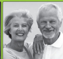
Erwachsene & 55+