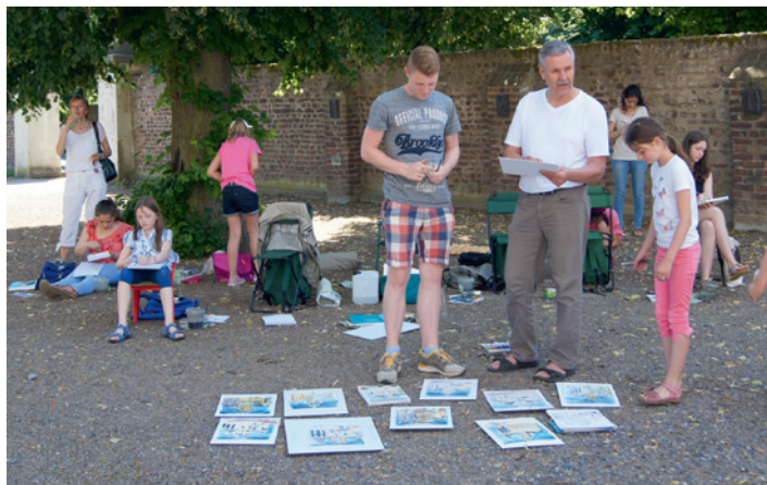
Jetzt zum ersten Mal auch im Kloster Knechtsteden ...