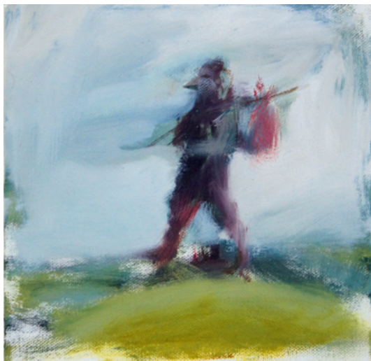
Der Wanderer, Öl auf Leinwand

In der Rubrik „youngartneuss“, wird dieses Mal ein vielseitiger Künstler aus dem Raum Neuss präsentiert.